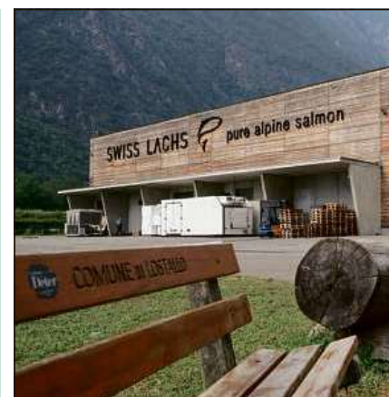
La tratga da salmuns a Lostalio.

Nagut cun gudogns. Spargnaders tar l'UBS cun contos ch'han si dapli che dus milliuns francs, ston a partir dal november da quest onn pajar 0,75% tschains negativs. L'argumentaziun: La fasa da tschains bass vegnia a cuntinuar, uschia che las bancas stoppian pajar vinavant tschains negativs a las