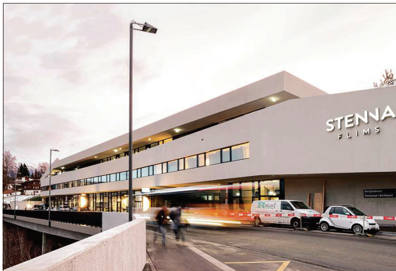
El niev Center Stenna ei vegniu investau 167 milliuns francs. La surbaghegiada colligia ussa Flem-Vitg cun Flem-Casa d'uau.

Als iniziants eis ei reussu da catter in investur cun la capacita' finanziaria, mo era