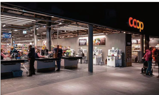
Sper habitaziuns, hotel e restaurants porscha il center era stizuns.

Il Center Stenna ei en possess dalla CSA Real Estate Switzerland, ina grupp d'investiziun dalla cassa da pensiu dalla Credit Suisse. Sviluppai il project dil Stenna ha la Senn Resources SA, l'architectura ei vegnida procurada da Baumschlager Eberle S. Gagl SA. Tut en tut ei vegniu investau 167 milliuns francs. La surfatscha dil baghetg principal munta a 12600 meters quadrat e la casa da parcar consista da sis alzadas. Il center porscha 1147 parcadis e 12 parcadis per cargar battarias d'autos cun tracziun d'electricitad. Spel baghetg principal secumpona la surbaghegiada era da tres casas cun totalmeins 135 habitaziuns da cumproprietad. Dil 22 da december 2018 entochen ils 4 da schaner 2019 vegn l'avertura dil center festivada sut il motto «Viva Stenna».