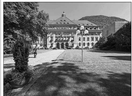
Uss è er il parc da la Retica accessibel ad in e scadin.