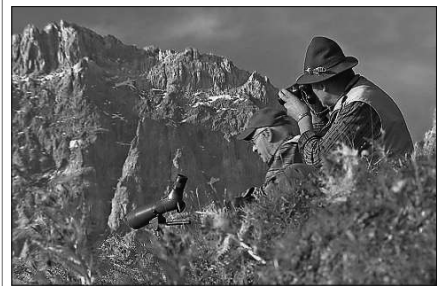
Chatschaders sin la chatscha en ils culms.

Il schacal che è vegni sajettà per sbagl il schaner passà en Surselva vegn expon en il Museum da la natira a Cuira. Davent dal fanadur pon ins admirar il schacal mellen en la vitrina dal museum. Il chatschader aveva sbaglià il schacal cun ina vulp.